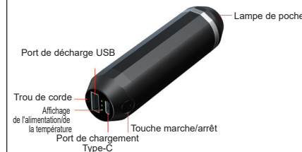
Schéma du produit